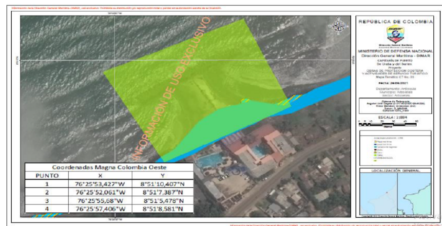
Figura 2. Área de intervención, de acuerdo a concepto emitido por DIMAR Radicado N° 182021101067

Que la zona de estudio se encuentra en un área total de trece mil ocho cientos ochenta y nueve (13.889 m 2 ), los cuales se encuentran en un terreno con características técnicas de zona de playas marítimas, bajamar o aguas marítimas, por lo tanto, se encuentran bajo jurisdicción de la Dirección General Marítima. De acuerdo a lo expresado por la solicitud bajo Número de radicado 182021101067 donde se solicitó un Concepto de Jurisdicción por parte de la Capitanía de Puerto de Urabá y del Darién, realizada inspección el día 24/05/2021.